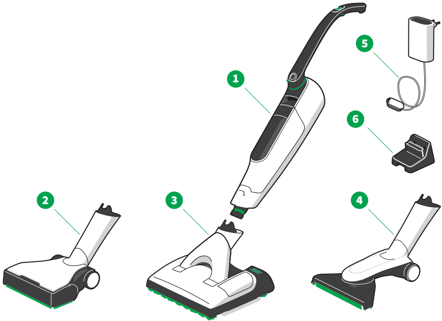
Kobold無線手持清潔機VK7、清潔吸頭和配件概覽